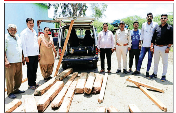
खाचरोद। वन अमले ने कार्रवाई कर जब्त किया लकड़ी और वाहन।