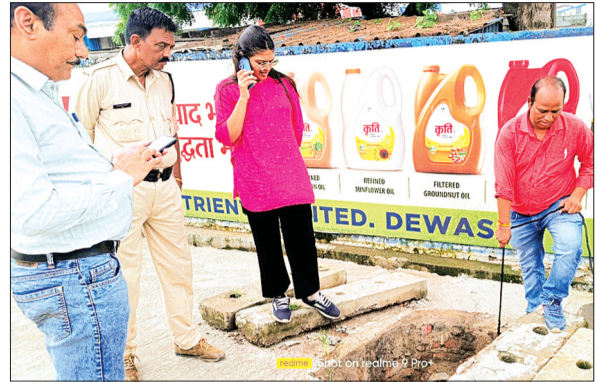
देवास। प्रदूषण विभाग ने लिए सैपल।